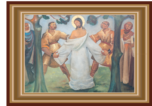
JEZUS WORDT VAN ZIJN KLEREN BEROOFT MATTEUS 27: 35, MARCUS 15: 24, LUCAS 23: 34, JOHANNES 19: 24, PSALM 22: 18-19

Kasten vol kleren en meestal hetzelfde aandoen omdat het zo lekker zit. Kleren maken nog steeds de man of de vrouw. Je met goedheid en liefde bekleeden maak een mooie mens van jou! Anderen in hun hemd zetten is zo gebeurd door geroddel of achterklap. Hij die nu van zijn kleren wordt beroofd is aanwezig in allen die worden bespot, gepest en getreiterd. Er zijn dus mantelzorgers nodig om dit tegen te gaan. Het gebeurt al waar mensen anderen omhelzen en bemoedigen. Wie weet kent u dit en was u er allang mee bezig.