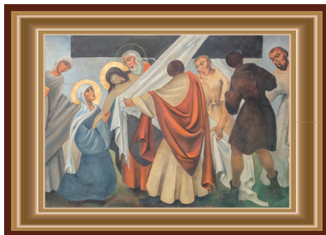
JEZUS WORDT VAN HET KRUIS AFGENOMEN