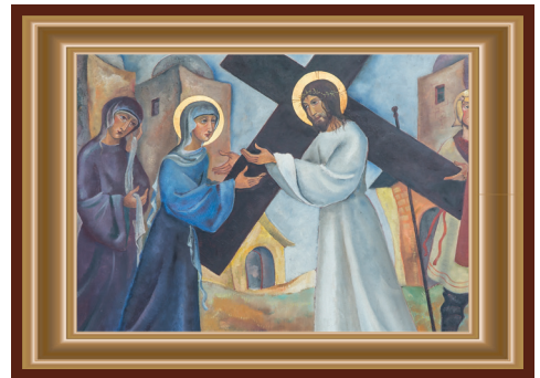
JEZUS ONTMOET ZIJN MOEDER MARIA

Je blijft altijd het kind van je vader en moeder. Ieder mens zal zich afvragen: 'Waar kom ik vandaan? Wie zijn mijn vader en moeder?' Maria ziet haar Kind dat lijdt. Zij voelt wat haar Kind moet doorstaan. Zonder woorden begrijpen zij elkaar. Het is een blik van verstandhouding. Hoe gaan wij om met onze kinderen? Als echte vaders en moeders? Als broeders en zusters? Gelukkig de mens die zich gedragen weet door begripvolle mensen die altijd de deur van hun hart openhouden.