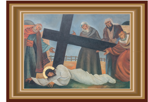
JEZUS VALT VOOR DE DERDE MAAL

Soms wordt het echt te zwaar en komt er te veel op je dak. Dat noemen we tegenwoordig een burn-out. De krachten begeven het. Het lichaam heeft tijd nodig om de geest weer in te halen en omgekeerd ook. Er zijn heel wat hulpinstanties, maar de belangrijkste is die van het begrip en meeleven van concrete mensen. Het is niet op te lossen met een berichtje, of door een stem die je na heel en lang wachten en emmers vol (on-)geduld door de telefoon zegt wat je moet doen. Zijn wij die hand op de schouder, die begrijpende blik, gewoon aanwezig als het nodig is?