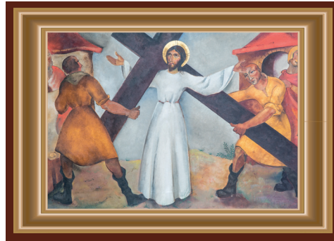
SIMON VAN CYRENE HELPT JEZUS HET KRUIS DRAGEN

Je denkers die hun hersens pijnigen en dan met een goed plan komen, maar ook mensen die zien, oordelen en (meteen) handelen. Simon zet de schouders eronder. Er is gelukkig nog veel goodwill onder de mensen, maar het is ook zaak om dit al zo vroeg mogelijk aan te leren. In de bange oorlogsjaren (1940-1945) had je mensen die met gevaar voor eigen leven dienstbaar waren. Is dat hetzelfde als anderen helpen bij het oversteken van een drukke weg, of degene die jouw zware koffer in het bagagerek legt? Eén ding is zeker; je moet er maar op komen en in bepaalde situaties de moed hebben om het te doen.