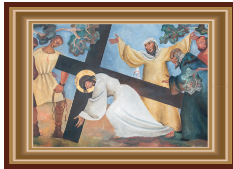
JEZUS VALT VOOR DE TWEEDE MAAL ONDER HET KRUIS

Dit jaar is het 80 jaar geleden dat ons land werd bevrijd. Nog steeds zijn er talloze monumenten voor de gevallen van de Tweede Wereldoorlog. Degenen die het echt hebben meegemaakt zijn onderhand op hoge leeftijd. Het verhaal van toen kan nog maar door weinigen zelf worden doorverteld. Toch mogen we nooit vergeten opdat het geen tweede keer gebeurt. Het verhaal van toen is een verwijzing naar de gevallen van onze dagen. Wie denkt er aan hen? Wie neemt het voor hen op?