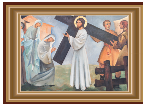
JEZUS ONTMOET DE WENENDE VROUWEN LUCAS 23: 28-31

Mannen die niet huilen zijn er genoeg en wenende vrouwen ook. Paus Franciscus komt uit Argentinië, een land waar indertijd veel wenende vrouwen dagelijks hun ronde deden op het Placa da Mayo in Buenos Aires om opheldering te vragen over hun vermiste mannen en kinderen, wel 30.000! Waar worden wij verdrietig van? Wie missen wij, of wat missen wij aan begrip, aan medeleven? Hopelijk huilen wij geen krokodillentranen, maar is het uit echte bezorgdheid en liefde voor de medemens die lijdt.