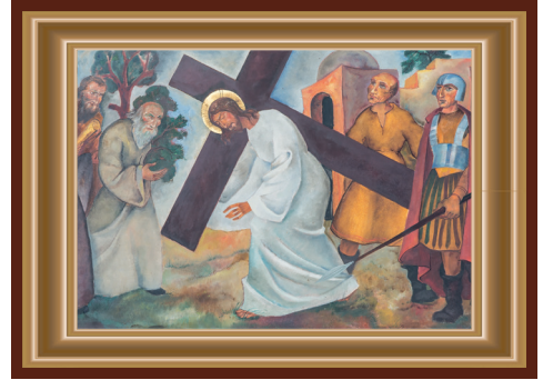
JEZUS VALT VOOR DE EERSTE MAAL ONDER HET KRUIS

Onderuit gaan, struikelen. Och ja, waar liggen ze ook alweer, die stroffelstiennen in onze stad! Niemand gaat graag onderuit. Het is voor velen een sport om met het leed van anderen op de loop te gaan. Een hele roddelpers is er op gebouwd. Het woord 'Fake News' doet dagelijks haar verwoestende werk en helpt mensen niet overeind, maar doet ze nog vaker vallen. Iemand die onderuit is gegaan en die graag weer verder wil is beter geholpen door echte vrienden die hun beste beentje voor zetten.