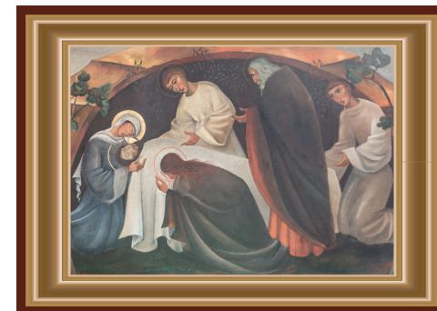
JEZUS WORDT IN HET GRAF GELEGD

Als de Geest eruit is wordt het koud en kil, maar waar licht is blijft de hoop. Is het licht van de engelen, van het Paradijs? Zelfs nu is er nog een dun streepje licht rond Zijn hoofd. In het Brabantse Uden koesteren de zusters Birgittinessen een beeld van Jezus die in het graf ligt. In de Goede Week brengen ze dat in de kerk. Op de open plek van het hart wordt de communie bewaard. Zijn Liefde is niet kapot te krijgen. Het Paradijs laat zich niet verdrijven. 'In Paradisum deducant te angeli'. Als dat gezongen wordt aan het einde van een Requiem, zoals dat op 4 mei van Gabriël Faure na de dodenherdenking, wordt het als vanzelf lichter om je heen!